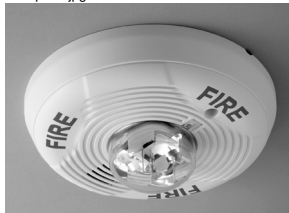
Buzina/Estroboscópio de teto interno