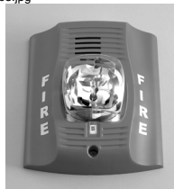
Buzina/Estroboscópio de parede interno