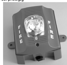
Estroboscópio de parede externa