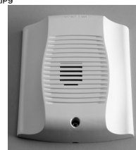
Buzina de parede interna