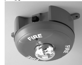
Estroboscópio de teto externo