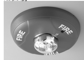
Estroboscópio de teto interno